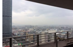
高層階のため眺望良好です。