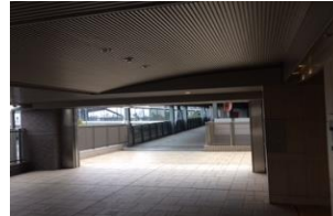
駅直結なので雨でも濡れません