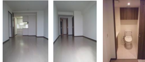
※上記写真は入居前のものです

★最新設備★TOYOキッチン・ディスポージャー・ミストサウナ・床暖房食洗器・ビルトイン浄水器・温水洗浄暖房便座トイレ ★安心セキュリティ★制震構造・24時間有人管理・録画録音付インターフォン・カメラ付きドアフォン・防犯センサー・内廊下